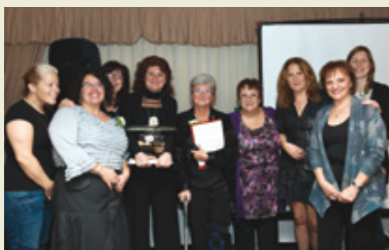
Équipe du Programme jeu pathologique