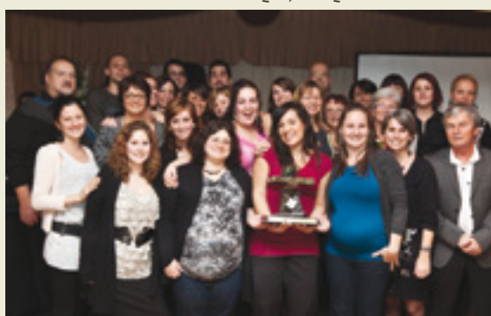
Équipe du Programme interne de désintoxication